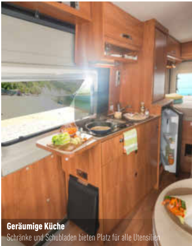
Geräumige Küche Schränke und Schubladen bieten Platz für alle Utensilien