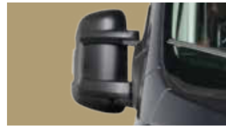
RÜCKSPIEGEL ELEKTRISCH VERSTELL- UND BEHEIZBAR