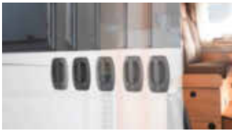
SOFTLOCK SCHLIESSHILFE SCHIEBETÜR