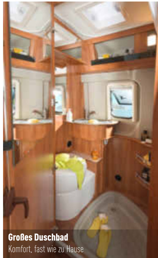
Großes Duschbad Komfort, fast wie zu Hause