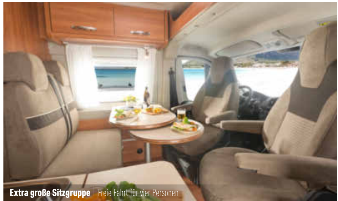
Extra große Sitzgruppe | Freie Fahrt für vier Personen