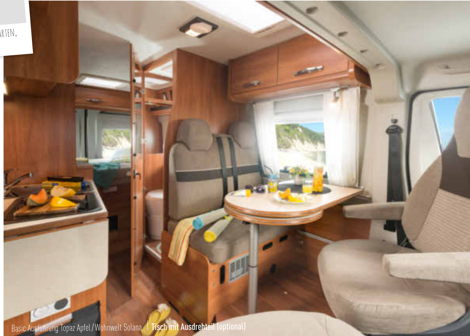
Basic Ausführung Topaz Apfel / Wohnwelt Solana | Tisch mit Ausdrehteil (optional)

FÜR ALLE, DIE AUCH VOM FAHRZEUG SOVIEL ERWARTEN, WIE VOM KOMFORT DES AUSBAUS