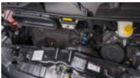
STARKE MOTORISIERUNG 2,0 l BlueHDI • 120 KW / 163 PS • 3,5 t