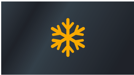
KLIMAAANLAGE IM FAHRERHAUS