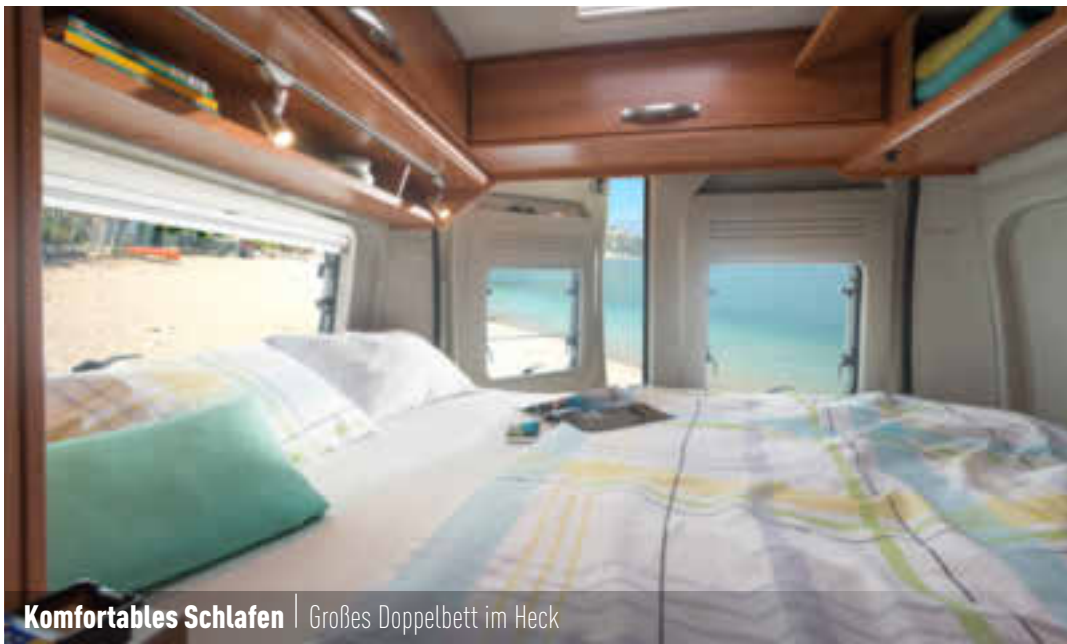
Komfortables Schlafen | Großes Doppelbett im Heck