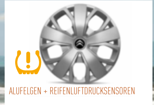
ALUFELGEN + REIFENLUFTDRUCKSENSOREN