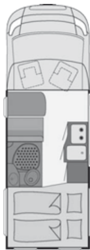
Disegno non contrattuale