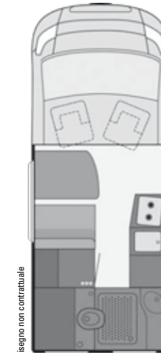
Disegno non contrattuale