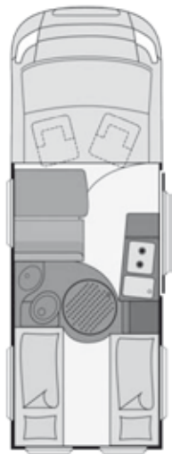
Disegno non contrattuale