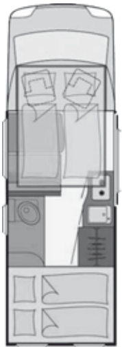
Disegno non contrattuale