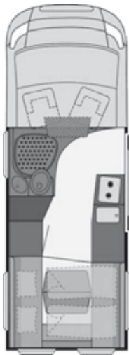
Disegno non contrattuale